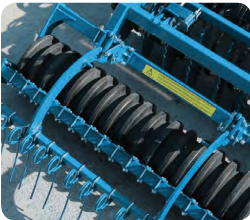
Gomme Sillonneur Ø 560 mm