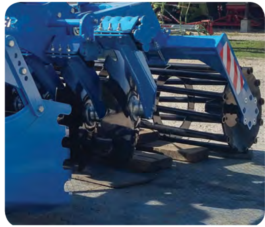
Tube Ø 600 mm