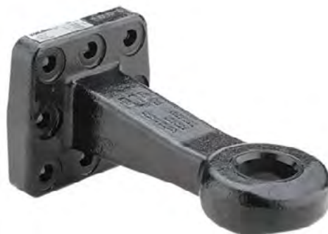
Attelage à anneaux

Ce déchaumeur combiné est composé d'un timon avec report de charge hydraulique et d'un attelage à anneaux.