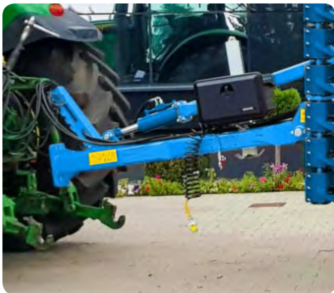
Vérin de report de charge