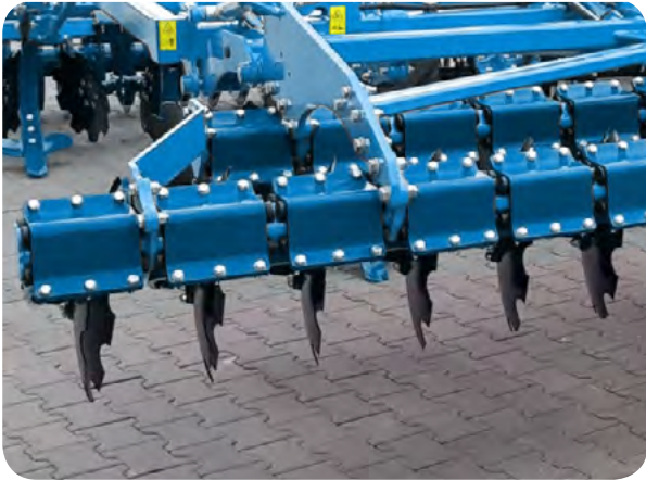
Double rangée de disques