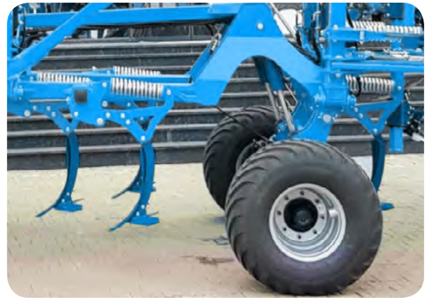
3 Rangées de dents

La double rangée de disques est suivie de 3 rangées de dents se recroisant parfaitement pour un travail sur l'intégralité de la surface. Celles-ci sont suffisamment espacées pour gérer les gros flux de matières, éviter tout bourrage et ainsi assurer le bon nivellement de terrain.