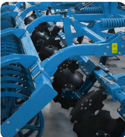
Rangée de disques concaves crénelés

Pour finir, KRISTINA dispose d'une rangée de disques concaves crénelés Ø 460 mm avec des roulements sans entretien. Ces disques ont pour tâche première d'effacer le passage des dents qui elles travaillent tous les types de sols en profondeur.