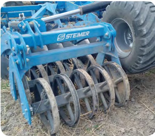
Double U-Ring Ø 500 mm