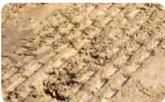
• Pieds de mouton Ø 500 mm