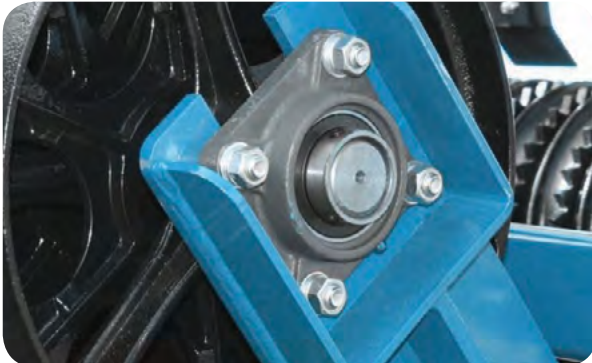
Arbres Ø70 mm

Les arbres de grand diamètre (Ø70 mm) offrent une bonne résistance. Ils supportent bien la charge et les impacts, même dans les sols pierreux.