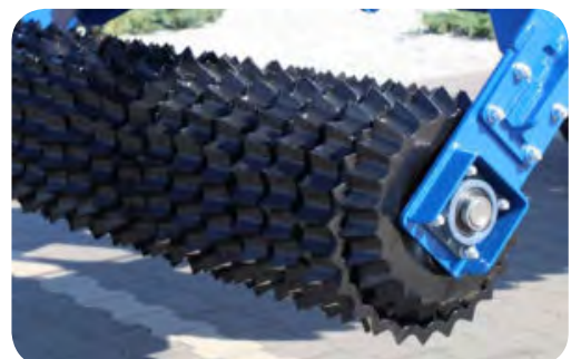
Pieds de mouton

Le rouleau à pieds de mouton ou compacteur à pied dameur est très polyvalent. Tout d'abord, il assure un lit de semences de qualité avant la passage du semoir. Il permet également de régénérer les prairies. Cette machine convient tout particulièrement au compactage des sols cohésifs. Ce rouleau raffermi simplement et efficacement le sol tout en cassant la surface.