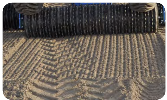
• Cambridge classique Ø 530 mm