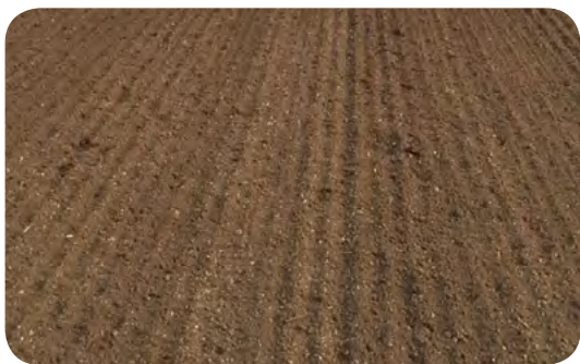
• Croskill Ø 500 mm