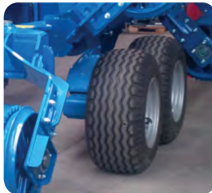
Roues Tandem 380/50-17

Le confort de KASIA provient également de ses roues larges et de son essieu Tandem sur la version 9,4 m. Cela procure une bonne stabilité sur la route, et permet de ne laisser que très peu de traces lors du travail de la terre.