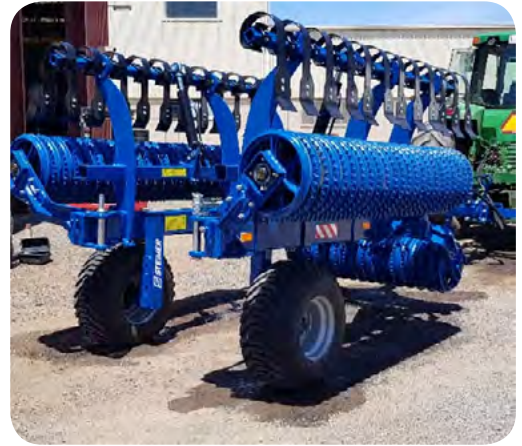
Châssis - rouleaux repliés

Le châssis de KASIA , auto-porté, est très robuste. Selon la largeur, il est réparti en 3 ou 5 sections de rouleaux, repliables à l'aide du système hydraulique. Il pourra recevoir une rangée de Crossboards hydraulique en option.